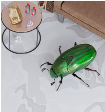
Auto Italia, On Coping

Apakah kamu mengamati media—atau media yang mengamatimu?